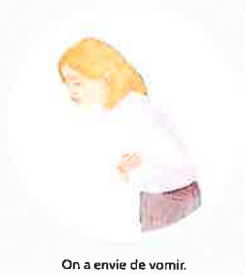
On a envie de vomir.