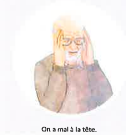
On a mal à la tête.