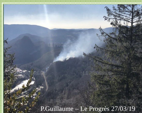
P.Guillaume – Le Progrès 27/03/19

60 ha de forêt sont partis en fumée suite à un feu mal maîtrisé sur la commune de Maisod 3