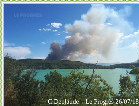
C.Deplaude – Le Progrès 26/07/18

➔ Combustibilité et inflammabilité en période de défoliation