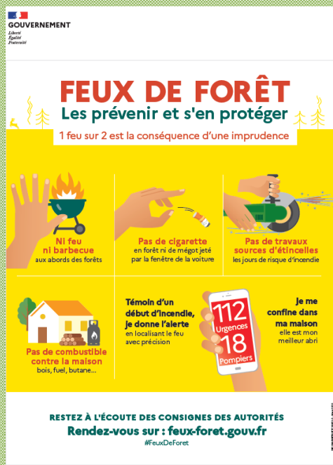
Affiche de la campagne nationale - 2020

Si nécessaire, prise d'arrêtés préfectoraux d'interdiction d'usage du feu dans certaines communes à risques